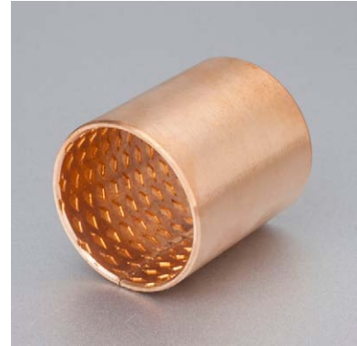
内外倒角 ID and OD chamfers